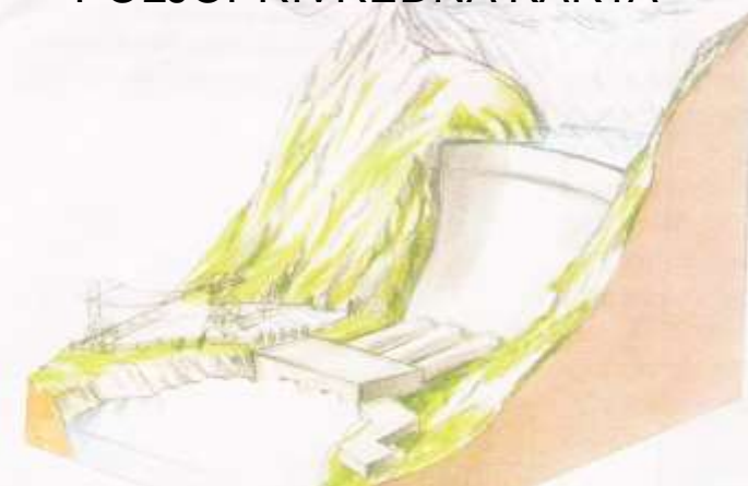
HIDROELEKTRANA U NORVEŠKOJ